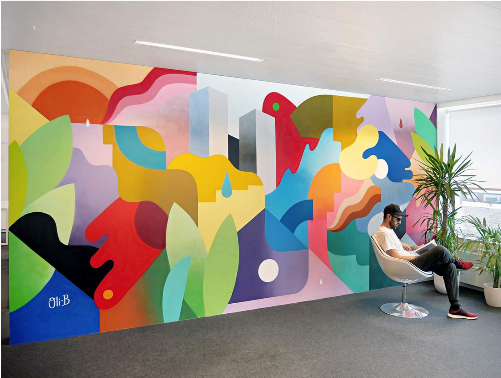
Mural Painting at ADNEOM Brussels