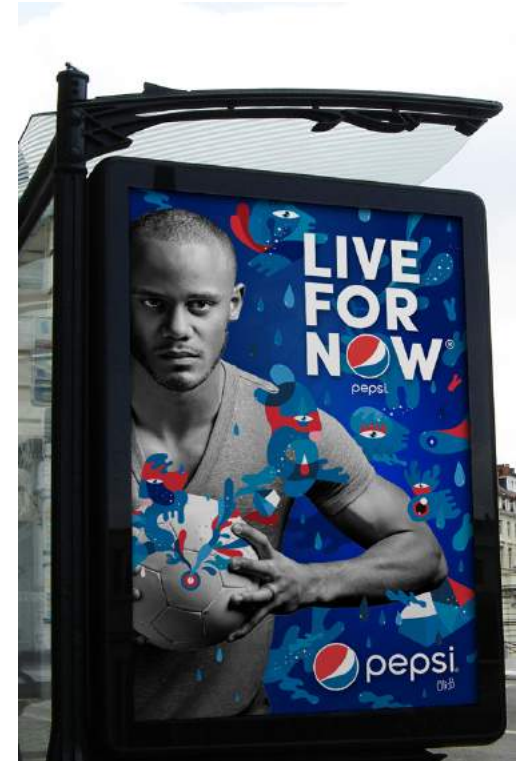
PEPSI, VINCENT KOMPANY & OLI-B