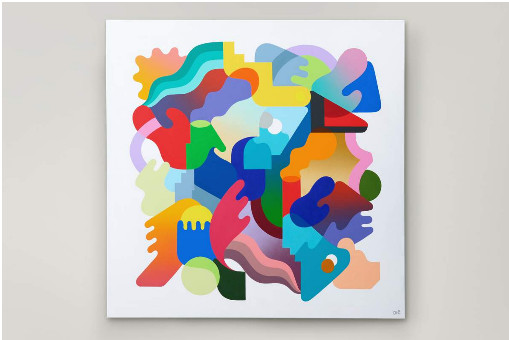
Oasis Painting on canvas 2018 Private collection