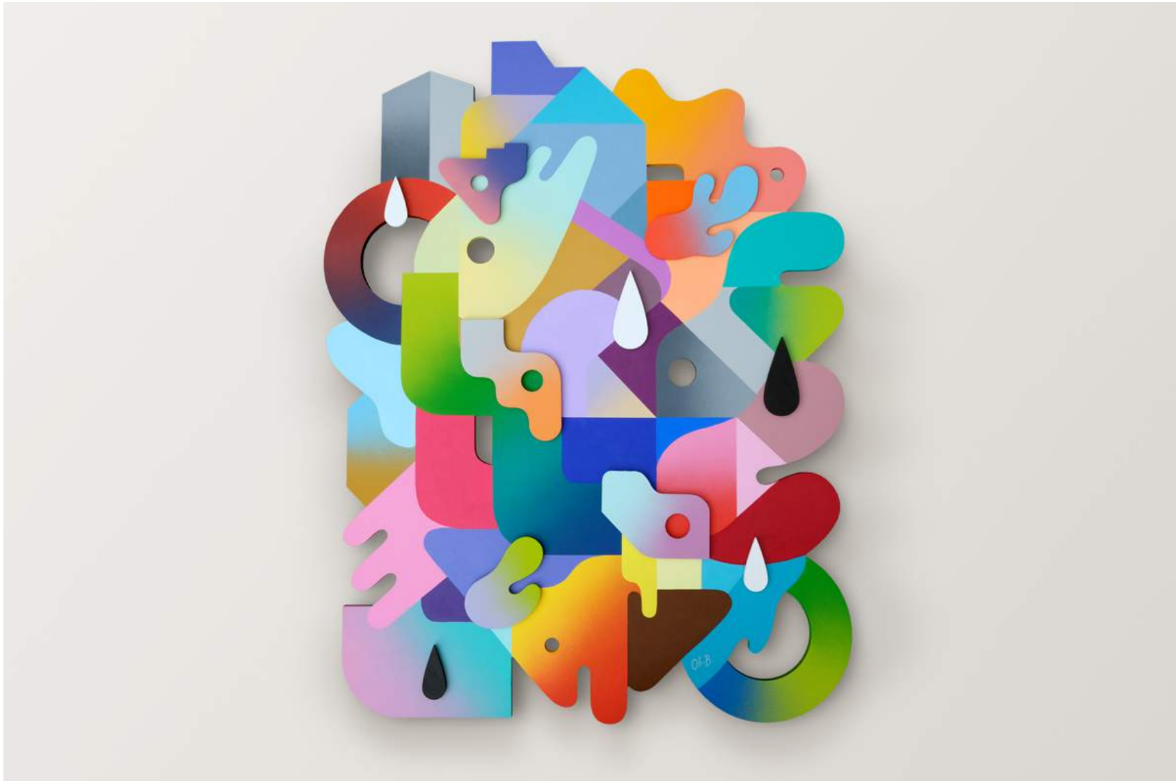
Totem 9 Painting on wood 2018 Private collection