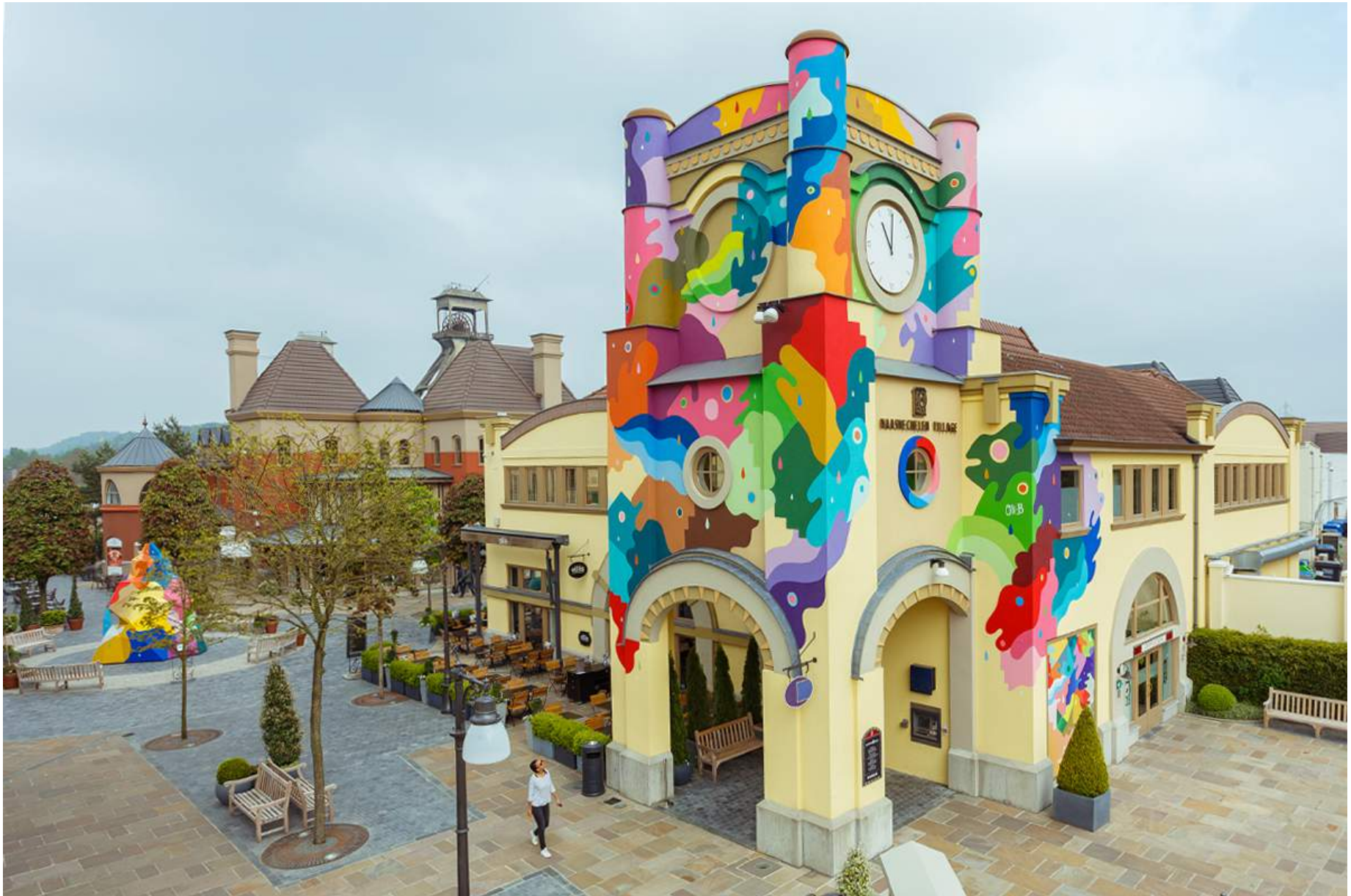
Oli-B X Maasmechelen Village