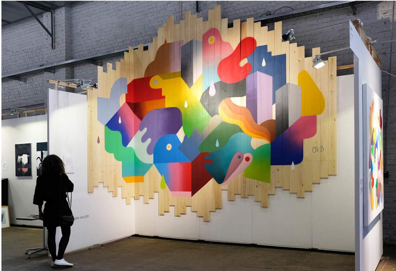
Painting on wood Installation