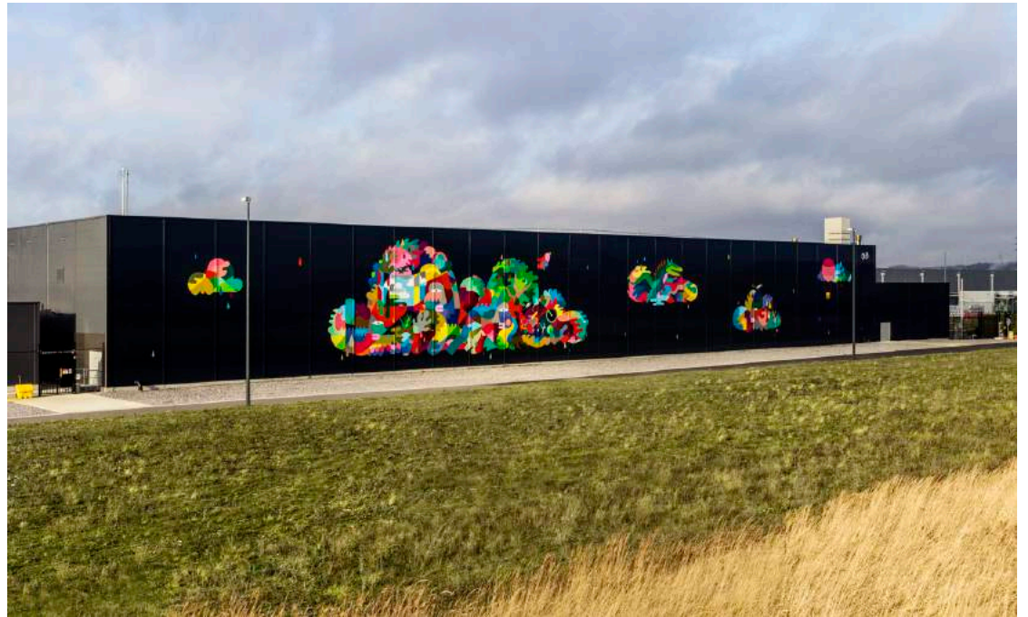
GOOGLE DATA CENTER Mural project